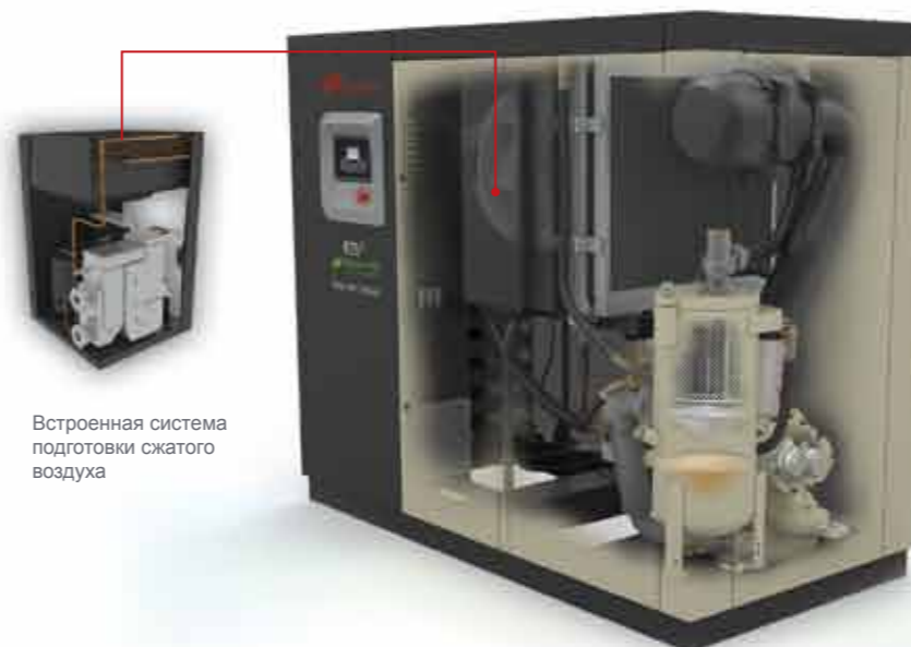
Встроенная система подготовки сжатого воздуха